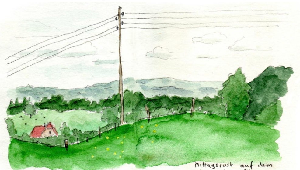
Mittagsrast auf dem Gürbetaler Höhenweg. 27.5.19 ch.B.

Die Gruppenzusammensetzung, das Wetter, die Landschaft – alles hat gepasst und wir haben es genossen!