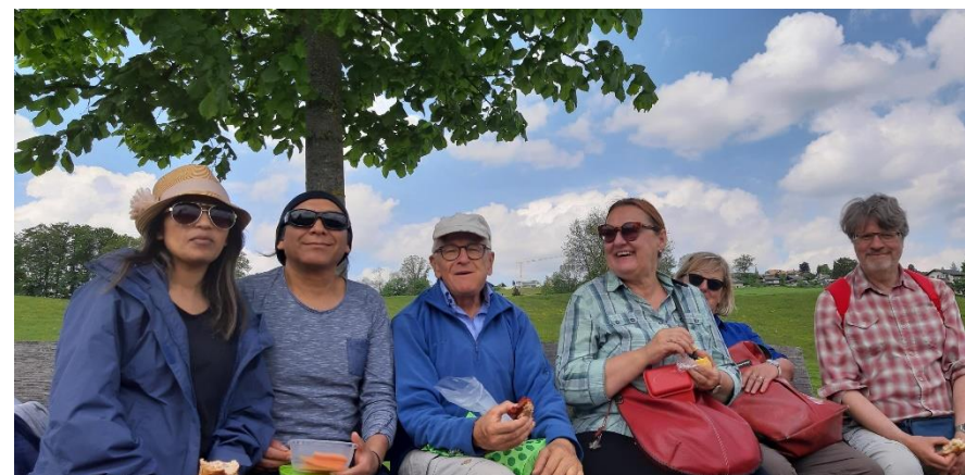
Zeichnung: Christian Bühler